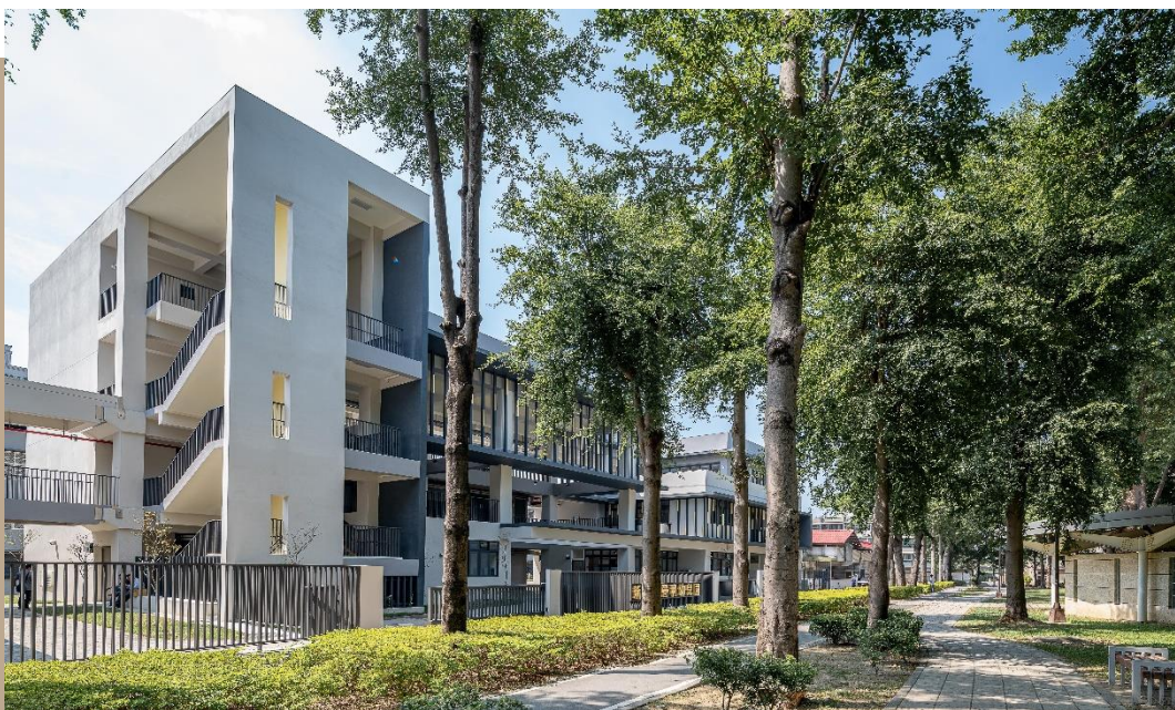
高雄市新甲非營利幼兒園