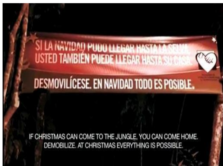
圖二 《Wired UK》的報導，耶誕行動

產生聯結就永生無法脫離，所有的人 生夢想都跟這組織綁在一起，但是立場雖不同但不會影響大家過聖誕節，索羅格夫說：「在我們的團隊裡有個天才，他說：『我發現每到聖誕節，游擊隊都會出現一波退役潮，從戰爭開始時就是如此。』這是個重要的發現，因為這讓我意識到，我們應該和『人』對話，而不是老想著是和『軍人』對話，在和談期間，我們一直想用和平的手段解決問題，因此我們決定嘗試一些完全不同於以往的方法就是用聖誕燈飾。」於是 2010 年，兩架黑鷹直升機搭載著兩隊視死如歸的勇士，深入叢林深處的游擊隊大本營，為游擊隊員帶去了佳節的祝福。 17 據媒體報導，向來進入叢林只是為了作戰的政府軍，協助廣告公司團隊在游擊隊出沒的叢林當中，在 9 棵約 22 公尺高的樹上，掛上約 2,000 顆 LED 燈泡，還有一面橫幅廣告旗幟，上面寫著：「如果聖誕節能在叢林出現，你也可以回家，投誠吧！」「繳械吧！在聖誕佳節之時，沒有什麼是不可能的」。 18 (如圖二)