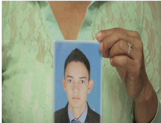
圖四 孩子，回家一起看世界盃吧

資料來源：周大觀服務網，〈【用創意促成和平】〉，《哥倫比亞和平推手－何塞·米格爾·索格羅夫》