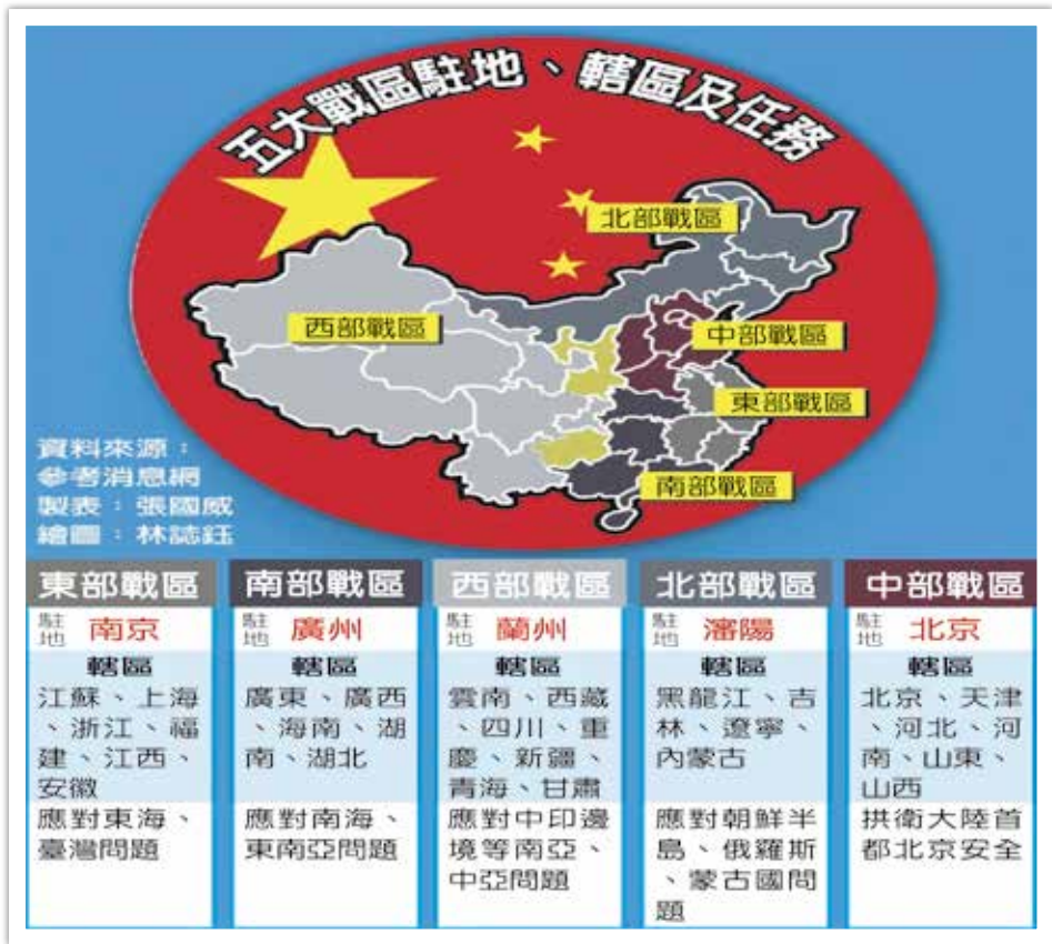
圖1 共軍五大戰區駐地、轄區及任務

盾和問題，提高我軍能打仗、打勝仗的能力，歸根結柢要靠改革。 47 」據此，習近平軍改後「三戰」職能機關的調整，始終