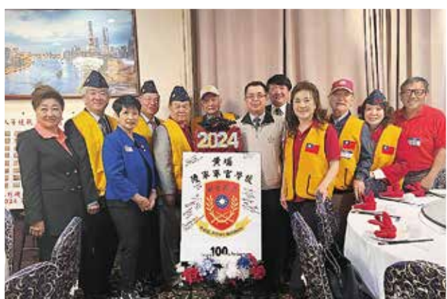
倪參事率領輔導會駐美榮光組，訪問旅美洛杉磯榮光會時合影。