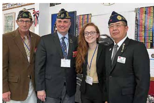
倪參事（右一）與美國退伍軍團協會全國總會會長（左二）合影。