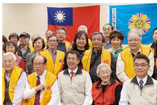
倪參事率領輔導會駐美榮光組，訪問旅美紐澤西榮光會時合影。