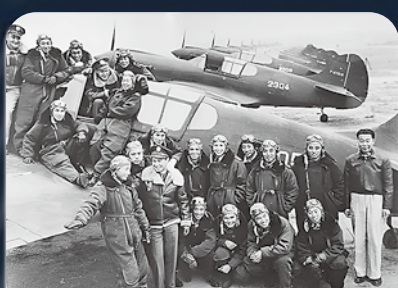
第三十三中隊合影【本社資料照片】。

動熱絡。後來兩年，每逢四月倪參事都會前往舊金山，邀約當地僑界一起拜會朱老師並為他慶生，以感謝他當年對中華民國所做的偉大貢獻。