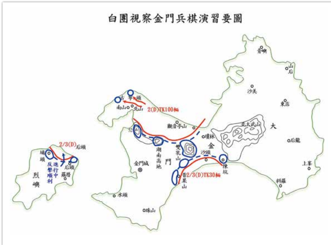
圖3 白團視察金門兵棋演習要圖