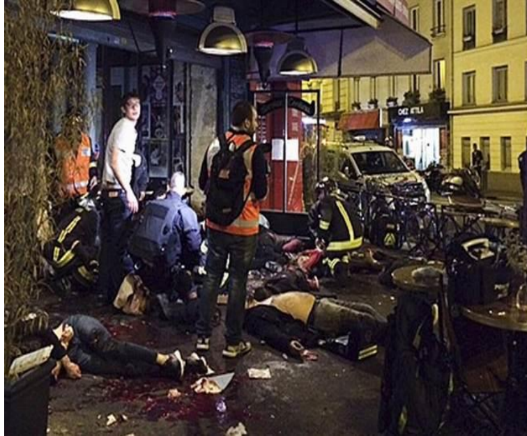
圖二 2015 年法國巴黎恐怖攻擊事件