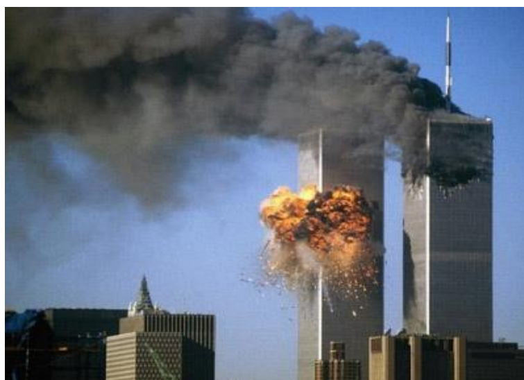
圖一 美國 911 恐怖攻擊事件