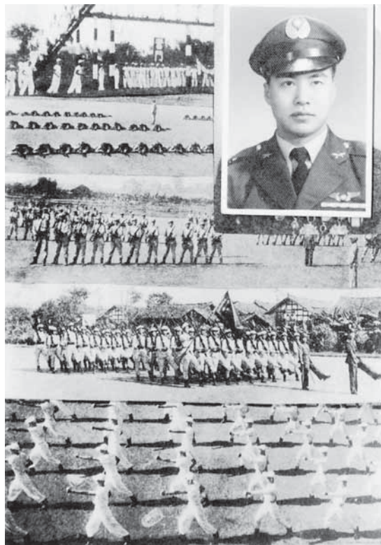
四川銅梁入伍訓練時的照片。

在寨頭的小學畢業後，他考進了洪江省立十中，民國卅一年初夏，長沙第三次會戰後，湖南省的情勢變得