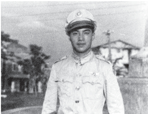
調到十二中隊之後在桃園隊部留影。