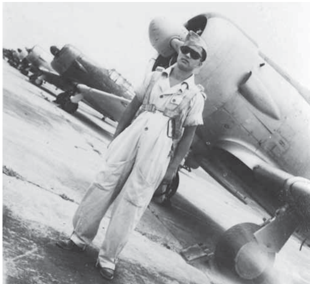
官校時練習駕駛AT-6教練機。

運地被錄取，到重慶航委會前集合報到後，乘十輪大卡到銅梁入伍。因為十萬青年從軍運動招來的飛行學生太多，經過總隊部的鑑定考試，被淘汰者，有的轉入其他兵科繼續入伍，有的被遣返，留下的四百四十人編入「空軍官校廿七期」入伍生，直到民國卅四年七月結業。